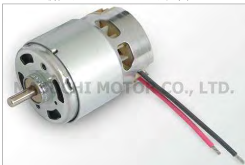
新产品 RZ-735VA 的外观