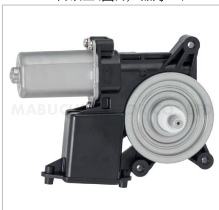
新产品 GD-558RF/LF ECU内嵌型(图片产品为RF)